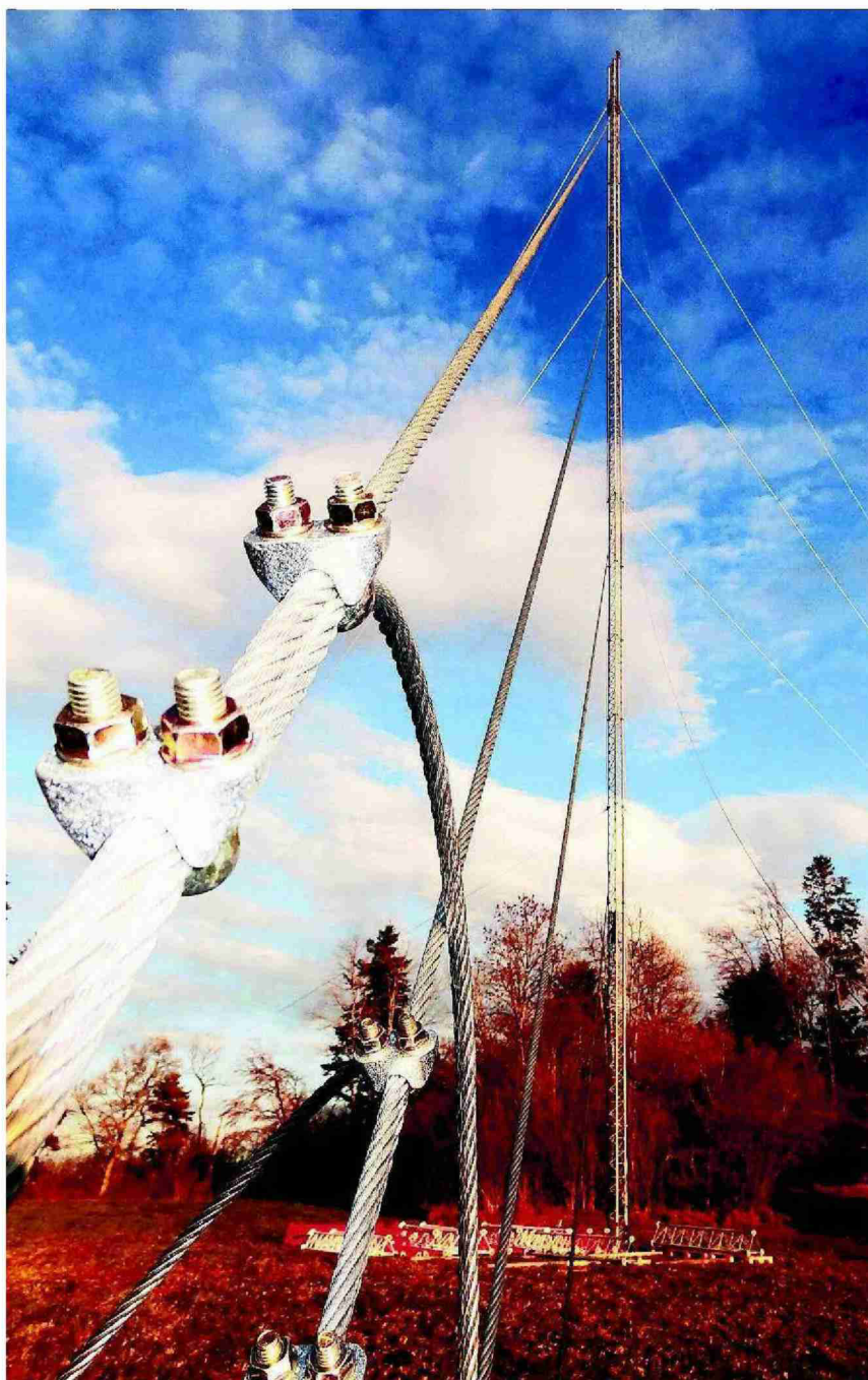
Der Messmast in Kienberg soll Aufschluss über die Windverhältnisse im Gebiet des geplanten Windparks Burg geben.

Themen-Nr.: 605.11 Abo-Nr.: 605011 Seite: 36 Fläche: 46'816 mm 2