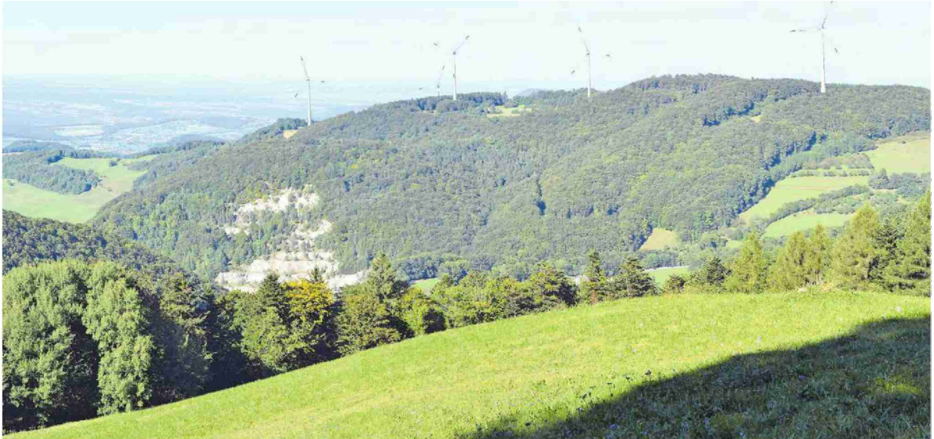
Die Visualisierungen der Windpark Burg AG und der Vento Ludens Suisse GmbH zeigen, wo die vier geplanten Windkraftträder zu stehen kommen und wie sie in der Landschaft aussehen würden.